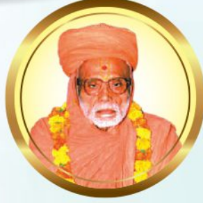
અ.નિ. મહંત સદ્. પુરાણી સ્વામી હરિસ્વરૂપદાસજી